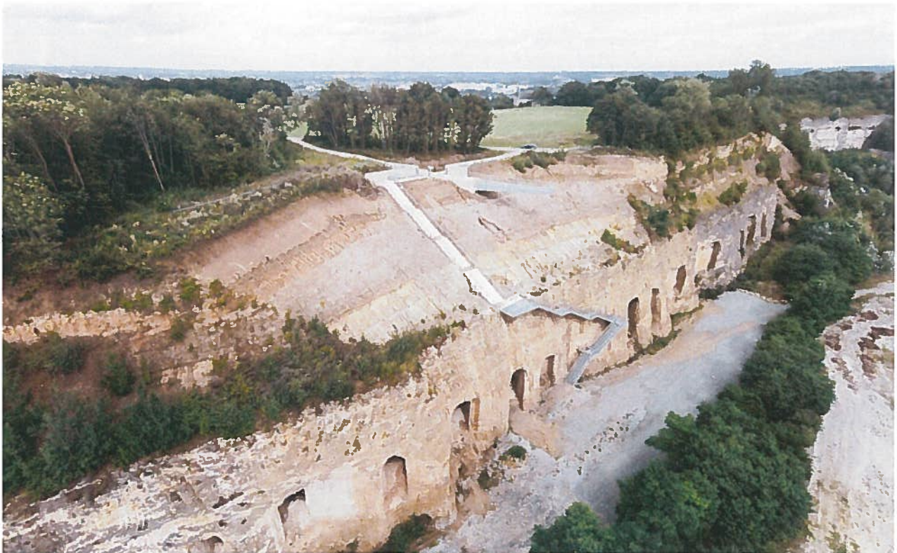
Zicht op de mergelgangen (oude mergelwinning) in de St. Pietersberg